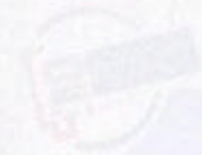
▲ Very British: Landesflagge und feine Decals machen auch aus New Mini ein kultiges Gefährt.

Individuelle Modelle Cycle Works NL-5911 HG Tel: +31 77 334 26 49 E-Mail: info@indivmodelle.nl