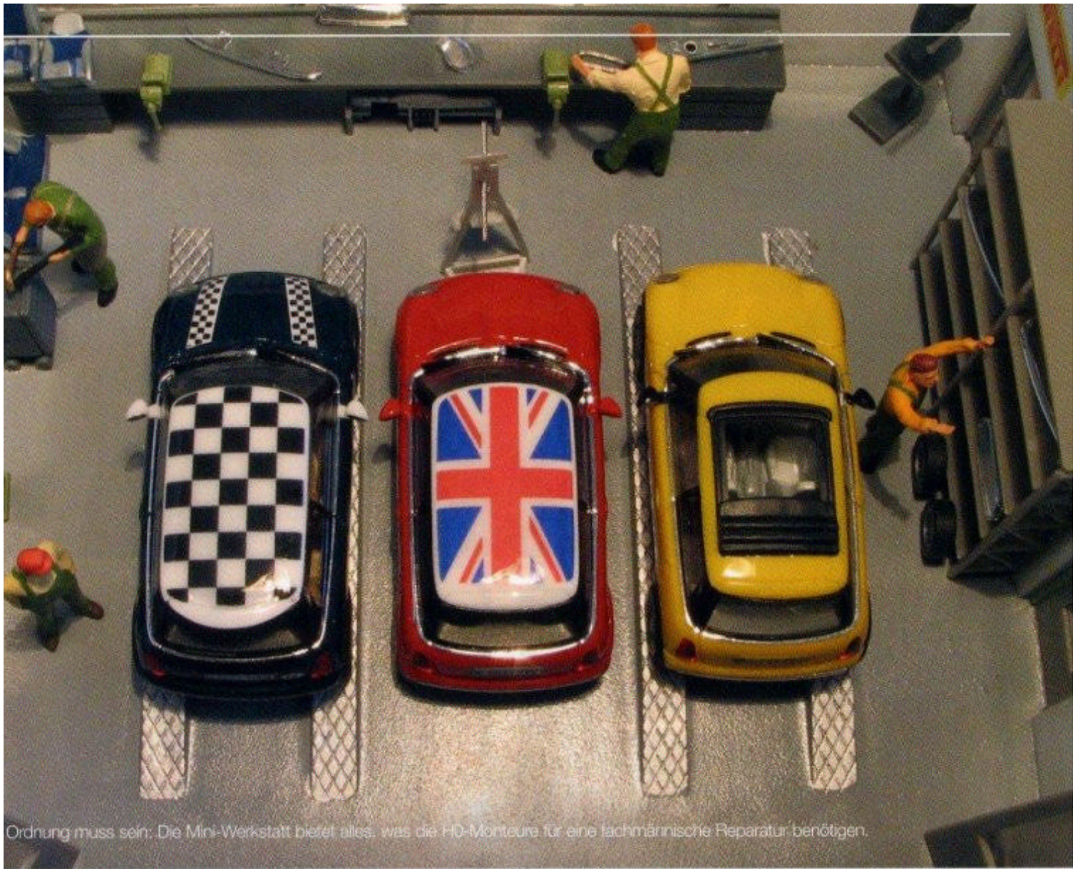
Ordnung muss sein: Die Mini-Werkstatt bietet alles, was die HO-Monteur für eine fachmännische Reparatur benötigen.